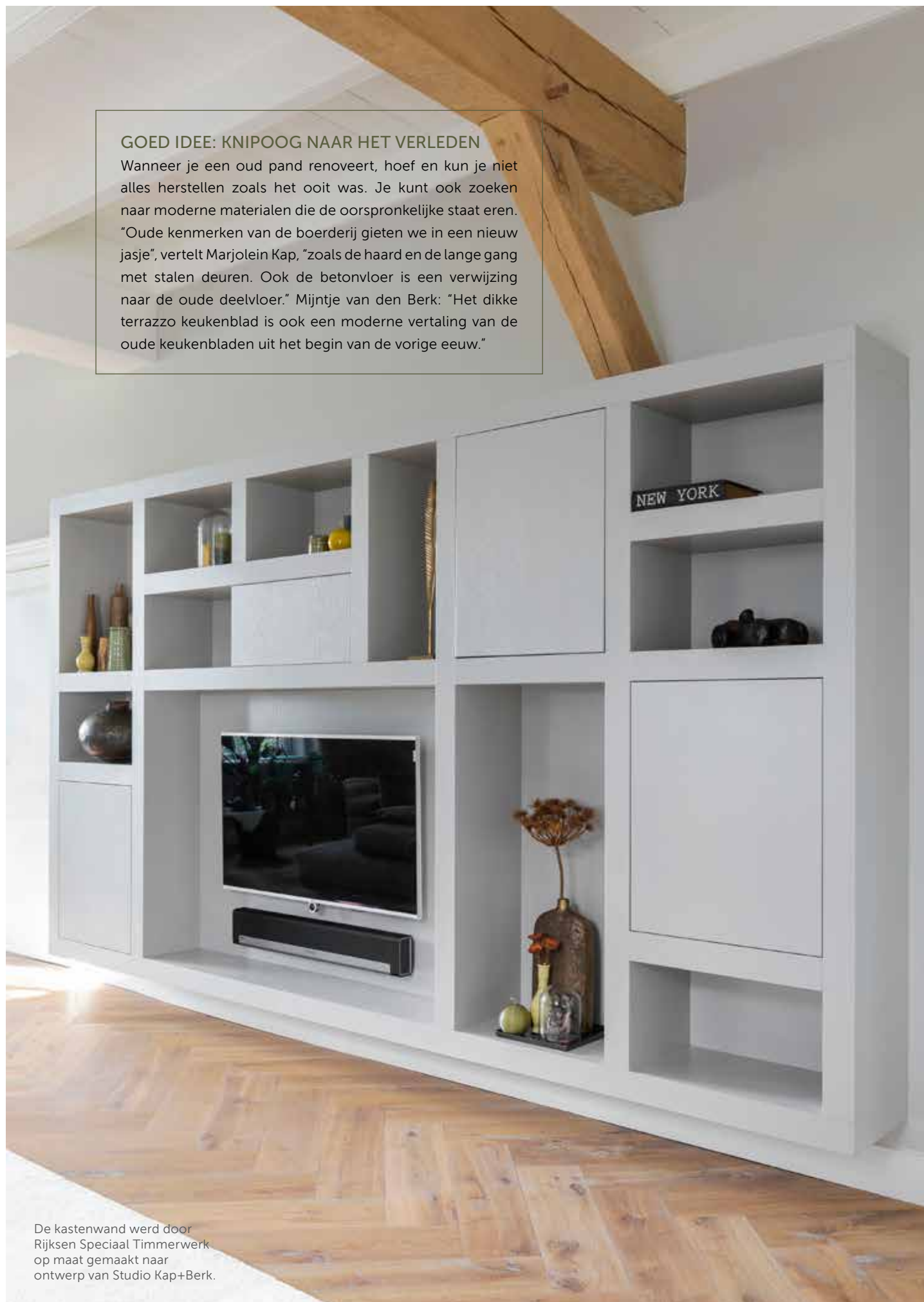
De kastenwand werd door Rijksen Speciaal Timmerwerk op maat gemaakt naar ontwerp van Studio Kap+Berk.

Wanneer je een oud pand renoveert, hoef en kun je niet alles herstellen zoals het ooit was. Je kunt ook zoeken naar moderne materialen die de oorspronkelijke staat eren. "Oude kenmerken van de boerderij gieten we in een nieuw jasje", vertelt Marjolein Kap, "zoals de haard en de lange gang met stalen deuren. Ook de betonvloer is een verwijzing naar de oude deelvloer." Mijntje van den Berk: "Het dikke terrazzo keukenblad is ook een moderne vertaling van de oude keukenbladen uit het begin van de vorige eeuw."