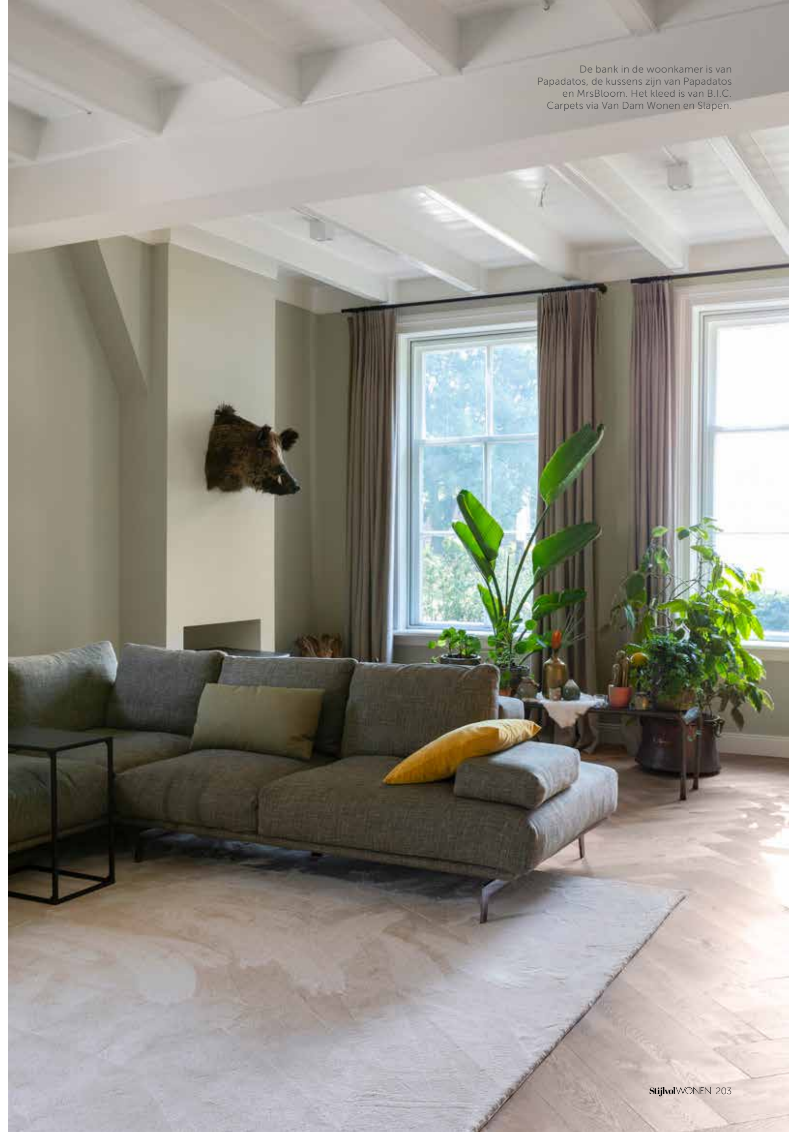
De bank in de woonkamer is van Papadatos, de kussens zijn van Papadatos en MrsBloom. Het kleed is van B.I.C. Carpets via Van Dam Wonen en Slapen.