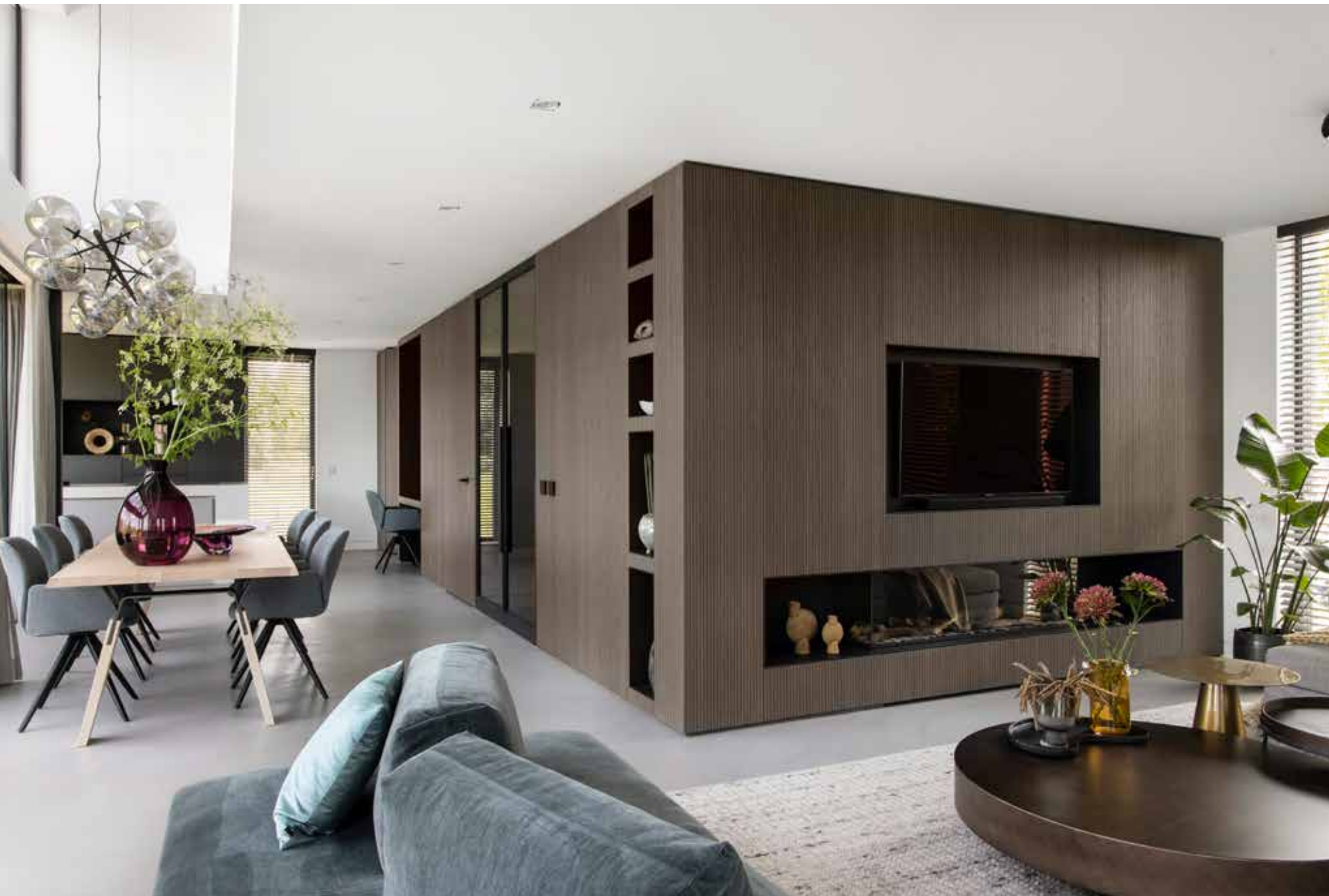
In het multifunctionele meubel verwerkte Studio Kap+Berk ook stalen nissen, een televisie en een haard. Meubels via Woon à la carte uit Heumen.

‘Het is een speelse keuken door de kastenwand die is opgesplitst en ruimte maakt voor een raam’