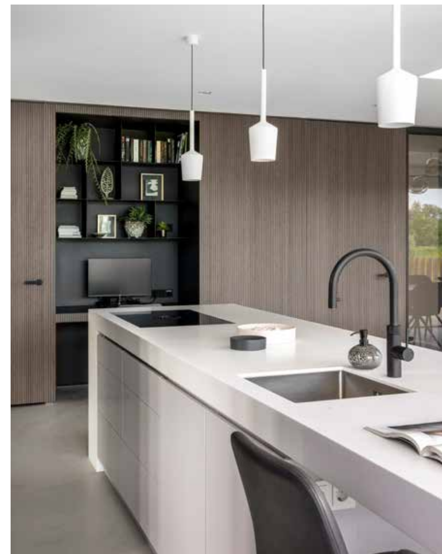
De keuken is naar ontwerp van Studio Kap+Berk uitgevoerd door Rijkssen Speciaal Timmerwerk, verlichting van Delta, Luux Light en Modular Lighting Instruments.